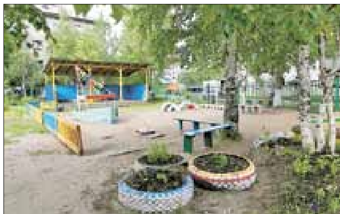
■ Детский садик № 173 «Подснежник»,