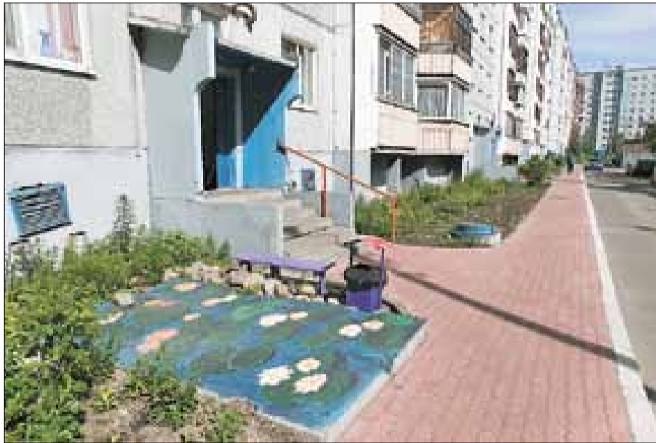
■ Пр. Новгородский, 35

В этом году строгое жюри определило троих претендентов на главный приз в конкурсе «Лучший дворик». Ими