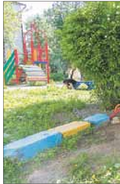
■ Ул. Гагарина, 2