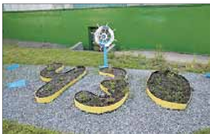
■ Детский сад № 148 «Рябинушка»