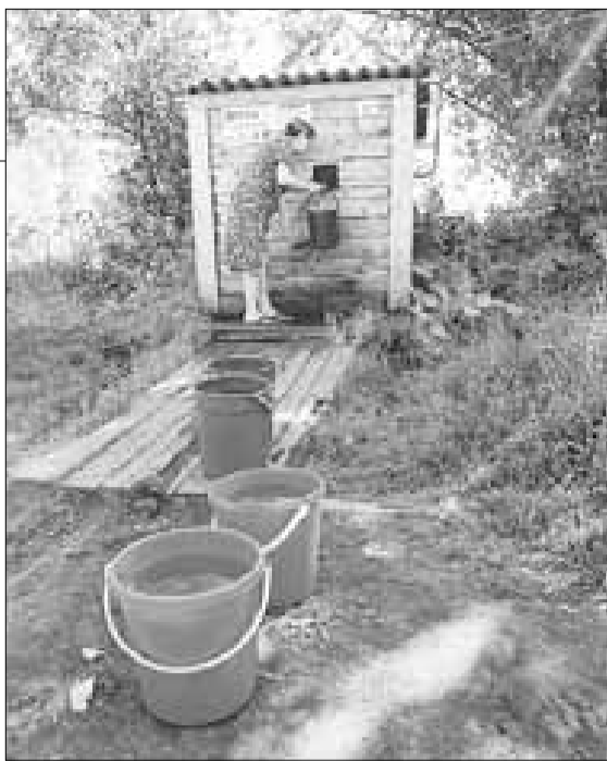
■ Колонки с приходом Джабарова тоже привели в порядок.