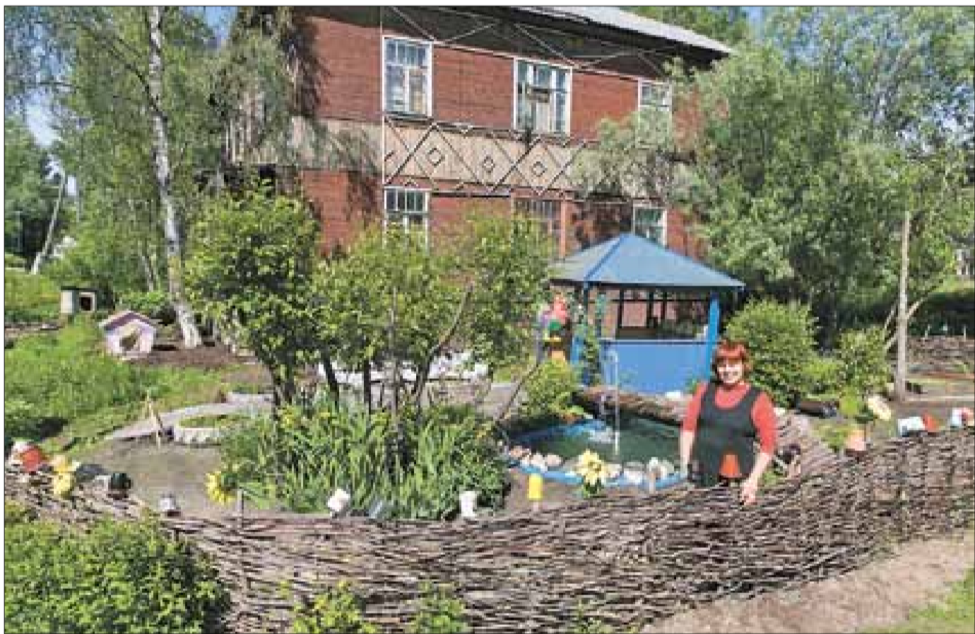
■ Ул. Советская, 75