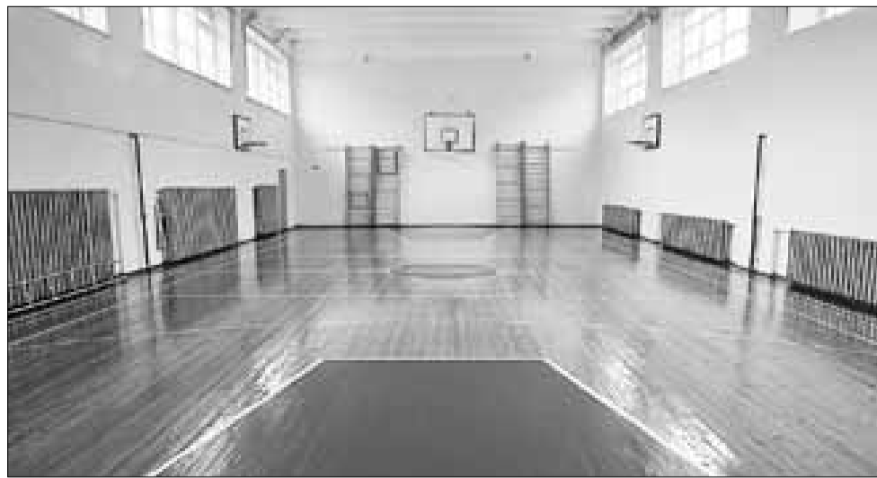
■ В школе № 11 готов принять ребят обновленный спортзал.

Не забыли в 14-й школе и о безопасности ребят: на смелую старую здесь установили новые пожарные щиты.