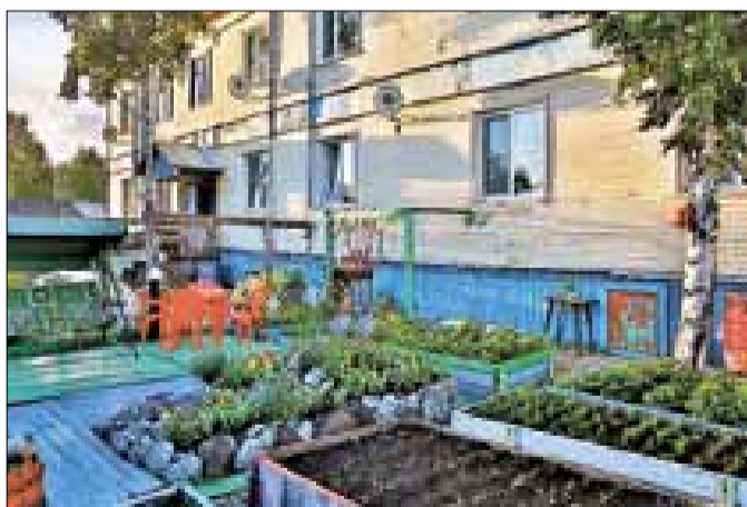
■ Ул. Заводская, 102