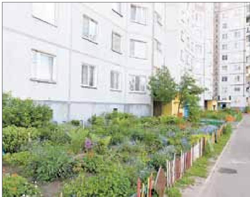
■ Ул. Стрелковая, 24