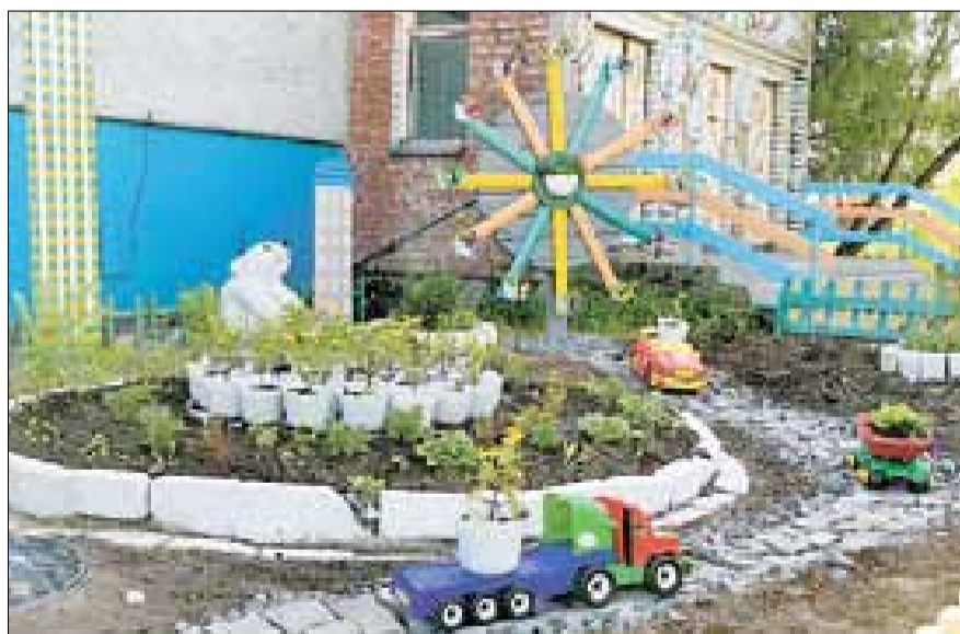
■ Детский сад № 140 «Творчество»