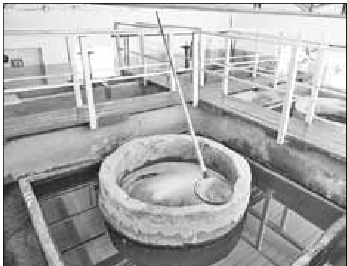
■ Очистка воды на скорых песчаных фильтрах.